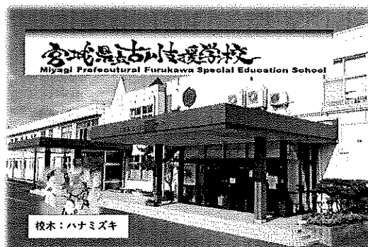
記念品「フォトフレーム」

令和3年6月「総会中止」のお知らせ(ハガキ) ※「成人を祝う会」について9月に再度案内する旨を連絡 令和3年9月「成人を祝う会中止」のお知らせ(ハガキ) ※平成30年、令和元年同窓生に送付 令和4年1月 成人者へ記念品(フォトフレーム)の送付 ※1月「成人の日」に合わせて郵送